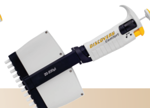
DV12 – 12-kanalowa