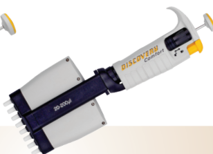
DV8 – 8-kanalowa