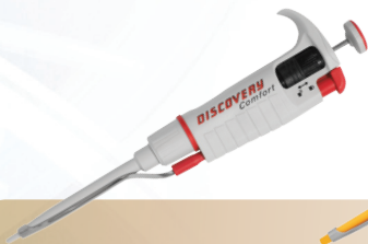
DV – szary trzon