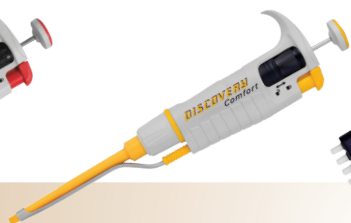
D – kolorowy trzon